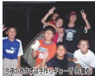
今夜のおかずは手作りギョーザ(写真左)