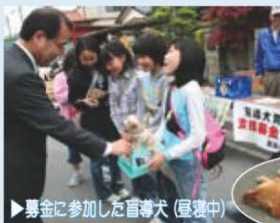
▶募金に参加した盲導犬(屋敷中)

4月29日、布佐駅東側大通りで行われた布佐新緑まつりで、布佐小児童が盲導犬の育成募金活動のお手伝いをしました。(写真)これは、我孫子ライオンズクラブが行っているもので、募金は多くの盲導犬を育てるための訓練などに使われます。