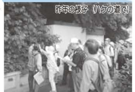
昨年の様子(ハケの道で)

新木地区には、「がまくら道」と呼ばれる古道が残っています。今回は、このがまくら道にネイチャーインします。風薫る初夏、いにしへの道を辿りながら我孫子の自然に触れてみませんか。途中、史跡なども訪れます。