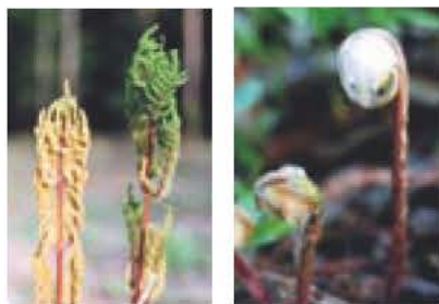
▲ゼンマイの胞子葉 ▲ゼンマイの若芽

四月の中頃、岡発戸市民の森を訪れると、新芽を伸ばし始めたゼンマイがありました。冬になると、ゼンマイの地上部は枯れますが、地下には塊根の根茎が眠っています。春になると芽を出し、葉を広げます。