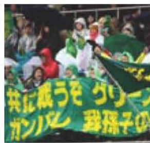
▲ラグビー-日本選手権決勝戦

スポーツ振興応援団は、中央学院大学陸上競技部とNECラグビー部「グリーンロケッツ」をはじめ、全国レベルで活躍する市内のスポーツチーム、スポーツ選手を応援します。