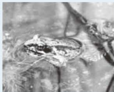
▲ニホンアカガエル(岡発戸谷津で)