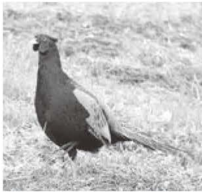
文 寺田夏芽(鳥の博物館)

日本の国鳥「キジ」はとても身近な鳥です。春を迎えた4月頃になると田んぼや畑の少し高くなつた場所で、雄のキジがケーン、ケーンという二声の後にドドドッと翼を体に打ちつけて大きな音を立てる「ほろ打ち」