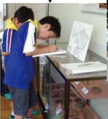
6年 歴史探検(将門神社)