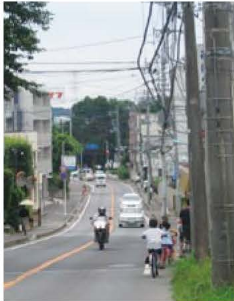
▲公園坂通り(我孫子駅から手賀沼公園へ)

☎ 都市計画課・内線578 後5時)して下さい。 Eメールか、直接持参(月曜から金曜日の午前8時30分から午後5時)して下さい。 ku@city.abikochiba.jp 9へファックスか、toshikeika 9へファックスか、toshikeika ku@city.abikochiba.jp Eメールか、直接持参(月曜から金曜日の午前8時30分から午後5時)して下さい。