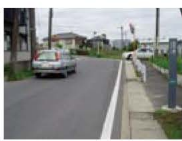
▲地権者の協力で拡幅された道路(布佐・新々田地先)

市では、通学路や交通量の多い箇所を中心に、歩道の段差解消や破損箇所の補修、通行危険箇所の解消など、安全で快適な道づくりを進めています。