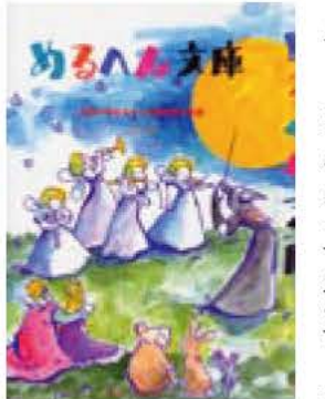
児童文学賞「めるへん文庫」の受賞作品を収録した作品集第3集を刊行しました。

全国の小・中学生、高校生を対象に夢いっぱいの子供の物語作品を募集しています。締め切りは9月30日です。皆さんの応募をお待ちしています。※応募方法など詳しくは、募集要項(教育委員会文化課、アピスタに用意)をご覧ください。(教育委員会文化課ホームページでもご覧いただけます) 教育委員会文化課 7185・1601