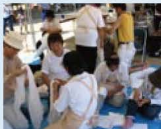
三角巾(きん)の使い方講習