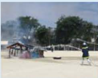
消防署・消防団による放水