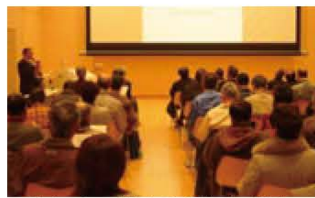
▲多くの方々が参加した前回の講座

今年、65団体が受け入れに協力します。地域活動を知るきっかけに、ぜひご参加ください。 体験期間 2007年2月まで(実施日は後日調整します) 参加費 無料(ただし、体験内容によっては実費負担あり) 申し込み ● 電話で市民活動支援課 ☎7185・1467へ 相談会 日時 8月21日(月)午後7時から8時30分、29日(火)午後3時から4時30分のうち都合の合う日 場所 あびこ市民活動ステーション(我孫子駅南口)やきプラザ10階 内容 インターンシップ概要説明、体験希望の相談、あびこ市民活動ステーションの紹介 申し込み 不要(直接会場へ)