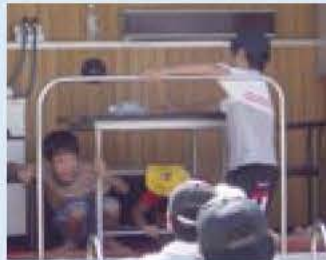
地震車で地震を体験