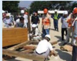
がれきの下からの救出