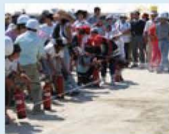
水消火器を使った初期消火

初期消火、建物火災の消火、地震体験(根戸小のみ)、煙体験、災害用伝言ダイヤル、災害救援ボランティアセンターの設置、防災用品の展示 ほか ※訓練終了後、炊き出し品を参加者全員に配布します。 ☎ 市民安全室・内線217