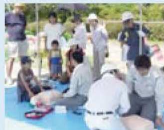
心肺蘇生(そせい)法の講習