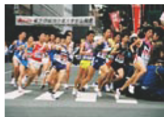
中央学院大学 陸上競技部 (駅伝)

9月には、市役所1階に、選手のユニフォームや試合の写真などの展示コーナーを設けます。