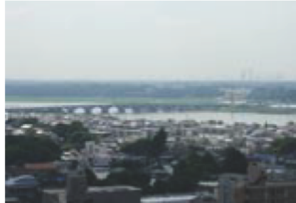
最上階から手賀大橋を望む

市の行政サービスセンターは、土曜日と月・水・金曜日の夜間も開いています。レストランがある最上階からの眺めは最高です。