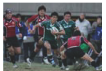
NEC グリーンロケッツ (ラグビー)

ラグビー日本選手権で2年連続優勝したNECグリーンロケッツ(写真)は、NEC我孫子事業場を拠点に活動しています。選手はほとんどが我孫子市民です。