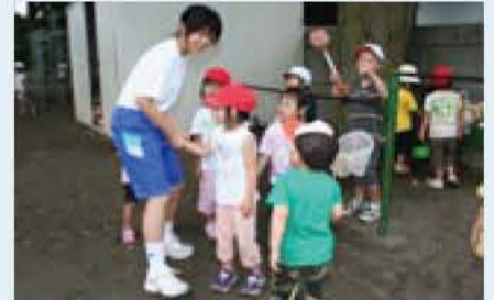
▲子どもたちと笑顔でふれあう(市内保育園での白山中生徒)

員会指導課 ☎ 7185-1367 FAX 7182-5867 Eメール shidou@city.abiko.chiba.jp へ 問い合わせ キャリア教育推進協議会事務局(教育委員会指導課) ☎ 7185-1367、生涯学習担当 ☎ 7182-0622