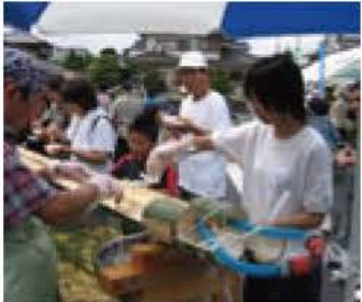
▲近隣センターまつりで中学生がボランティア

また、情報紙の内容は、我孫子市、あびこネットのホームページでもご覧いただけます。