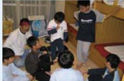
▲部屋でくつろぐ子どもたち

氏名、電話番号、性別、保護者の氏名を明記し、9月11日必着で〒270-1166 我孫子1684 教育委員会社会教育課へ 主催 我孫子市教育委員会、手賀の丘少年自然の家 問い合わせ 教育委員会社会教育課 ☎ 7185-1604