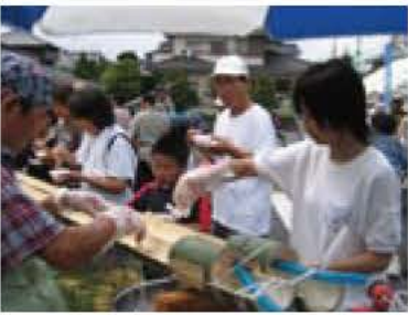
▲多くの方が来場した昨年のフェア

行委員会世話役・事務局)では、「市民活動フェアinあびこ2007」の参加団体と事務局スタッフを募集します。参加希望者と興味をお持ちの団体・個人の方は説明会にご参加ください。 日時・場所 9月24日(日)午前10時、我孫子南近隣センターホール(けやきプラザ9階) 内容 市民活動フェアの概要、実行委員・事務局スタッフの役割