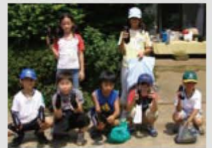
▲収穫した大きなナスを手に