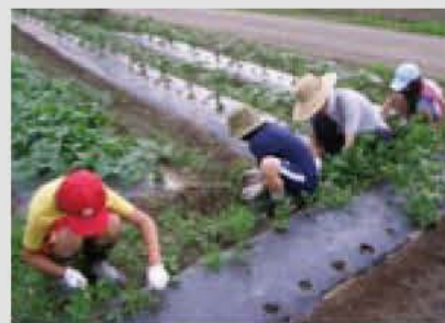
▲草取りは野菜作りに大切な作業