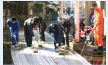
▲汗だくになってホースを掃除(消防署での湖北台中生徒〈昨年〉)

対象事業所 公共機関、スーパーマーケット、コンビニエンスストア、商店、農家など 申し込み 電話、ファクス、Eメールのいずれかで、事業所名、担当者名、電話番号、受け入れ可能な日数、人数を明示し、教育委