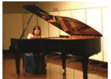
▲生演奏を間近で楽しめます