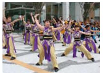
▲ロックソーラン (沼南よさこいゴチャ連)