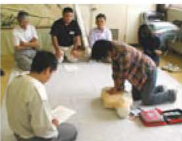
▲AEDの使用方法も学びます

消防署では、バイスタンダー(その場に居合わせた応急処置のできる人)を育成するため、普通救命講習会を開催します。 AED(自動体外式除細動器)：心肺停止者の心臓に電気ショックを与え、正常な状態に戻す(医療器具)の使用方法も学びます。 日時・場所 2月18日(日)午前9時から正午、消防本部2階大会議室(参加無料) 内容 心肺蘇生法、止血法、AEDの操作方法などの習得 対象・定員 市内在住・在勤で健康な方、先着25人 ※救命技能適正と認められた方には、講習後に修了証を交付。 申し込み・直接または電話で消防本部警防課 ☎7181・7701(土・日曜を除く午前9時から午後5時)