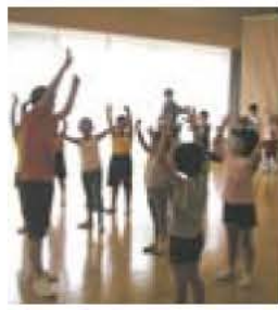
▲遊びの前の準備体操

市では、さまざまな特技や遊び、自然の中での遊び方を、子どもたちに紹介し一緒に遊ぶ「遊びの達人」と、達人のお手伝いをする「達人サポーター」を募集します。 「遊びの達人」と「達人サポーター」は、「遊びの達人教室」(月に1回程度実施)に登録し、子どもたちの活動場所や遊び場で開かれる「遊びの達人教室」でいろいろな遊びを教えます。 対象 「遊びの達人」：外遊び