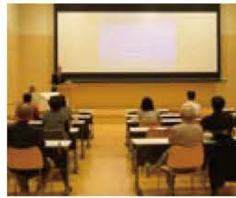
▲スライドを使った講座

やゲーム、昔懐かしい遊びなど(例：体を使った遊び、外遊び、科学工作、紙飛行機作り、ゲーム)を教えて下さる方 「達人サポーター」：遊びの達人のお手伝いをして下さる方 実施日 主に土曜日の午後 実施場所 近隣センター、公民館など 報償 1回4時間で1000円 申し込み・登録シート(教育委員会、各公民館・近隣センター)に用意。ホームページからダウンロード可)に必要事項を明記し、ファクス、郵送、Eメール、持参のいずれかで〒270-1166 我孫子1684 教育委員会社会教育課FAI7182・5867 Eメール syakaik@youkiku@city.abiko.chiba.jp 7185・1604