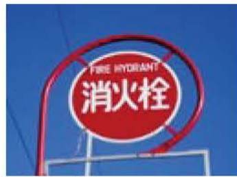
消火栓の近くに設置されています