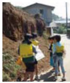
「くずれそうながけ」