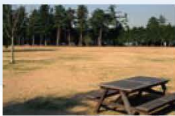
図 市民安全室・内線 295