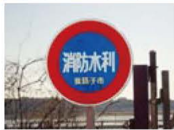
手賀沼やプールの水も使われます

消火活動に欠かすことのできない消火栓や防火水そうなどの周辺は、駐車が禁止されています。違法な駐車車両は消火活動を妨げ、1分1秒の遅れが大きな災害につながります。安全・安心なまちづくりにご協力をお願いします。 市街地で火災が発生した場合、消防車は消火栓や防火水そうから水をくみ上げ、消火活動を行います。 消火栓や防火水そうは、道路上や歩道上などに設置され、その位置を示すために、標識を掲げているもの、ふたや道路上に黄色の塗料で表示しているものなどがあります。 「消防水利」として指定されているプールや井戸、河川なども消火活動に使用され、標識が設置されています。(写真左) 消火活動は一刻を争います。消火栓などの付近に駐車しないよう、ご協力をお願いします。 19 西消防署 ☎ 7184-01 消火栓や防火水そうなどの周辺は、道路交通法で駐車が禁止されています(下欄参照)。 消防署では、火災の発生に備え、定期的に消火栓などの点検や整備を行っています。火災発生時に違法な駐車車両が障害となり、消火活動を妨げる事態が発生しています。