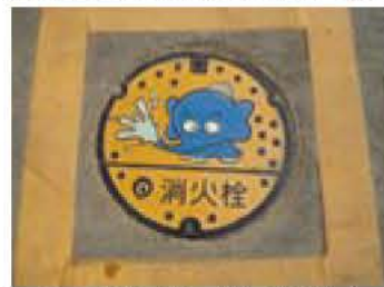
ここから水をくみ上げます