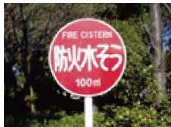
消火用水が貯えられています