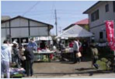
▲ i工房でのフリーマーケット

障がい者が地域でふつうに日常生活をおくり、社会参加ができるように実践的な活動を行っています。 主な活動は、小規模福祉作業所 i 工房の運営を中心に、重度の障がい者を含むさまざまな障がいを持つ方たちに、就労と日中活動の場を提供するとともに、将来の一般就労や社会復帰を目指して、種々の訓練を行っています。 また、チャリティイベント、L・Zコンサート(昨年は12月17日に開催)や障がい者によるアート展などの文化的な活動も行っています。 現在、夜間を含む生活の場を提供するため、グループホーム・ケアホームの開設準備を進めています。 「私たちの活動が、障がい者が障がい者という名称で区分されることなく、「ふつうに」地域で暮らしている物理的、精神的な環境を整う一助になれば」と榎本さんは語っています。 ※ i & i の2つの i は、自立と個性を表しています。 3 榎本 ☎ 7139・115