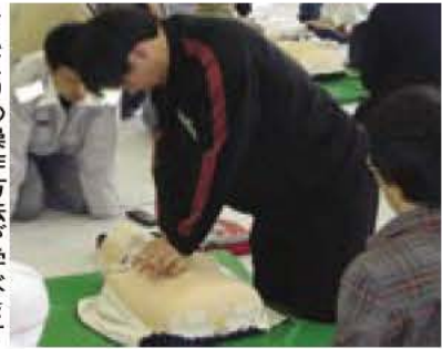
▶AEDの操作方法が学べます

消防署では、バイスタンダー（その場に居合わせた応急処置のできる人）を育成するため、普通救命講習会を開催します。 AED（自動体外式除細動器）心肺停止者の心臓に電気ショックを与え、正常な状態に戻す（医療器具）の使用方も学びます。