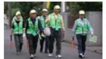
▲パトロール中の若松ふれあい会

自分たちのまちは自分たちで守ろう。自主防犯活動に参加する市民の方が年々増え、各地域で防犯・交通安全パトロール活動(写真)が活発に行われています。