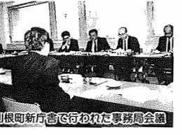
利根町新庁舎で行われた事務局会議

柳田国男サミットにむけ歴史学をよびかけ 柳田国男サミットにむけ歴史学をよびかけ 柳田国男サミットにむけ歴史学をよびかけ