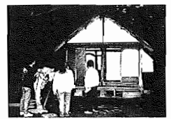
志賀直哉の書斎を撮影する 千葉テレビスタッフ 分から約15分、どうぞご覧ください。

市広報広聴課が企画、千葉テレビ放送制作の我孫子市を紹介する広報ビデオ「水辺のふるさと」が11月5日、12月10日の2回、千葉テレビ(UHF46チャンネル)で放映されます。 放映時間は、11月5日(日)、12月10日(日)とも、午前11時30