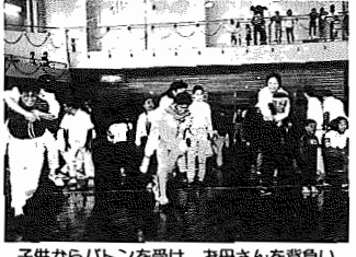
子供からバトンを受け、お父さんを背負いゴールへ。親子リレー