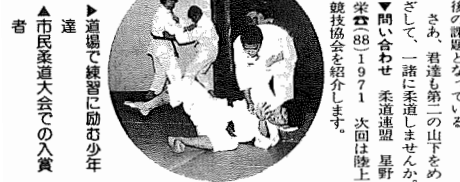
柔道連盟 柔道連盟は柔道を通じ、地域における青少年の健全な育成を図ることを目的として昭和26年に、5名の有志で発足。その後、昭和39年の東京オリンピックを境に、道連は高まり、現在、連盟会員は24団体180名、中学、高校、大学、社内活動、警察や町の道場でそれぞれ練習に励み、そして和気あいあいとした雰囲気から期待のよい汗を流している。

第3回 生垣作り講習会 11月4日(土)午前9時 湖北台中央公園 市では、緑豊か街づくりをすすめるため、生垣作りと冬の間に竹、樹木の害虫の防除・剪定方法などについての講習会を行います。 ▼日時 11月4日(土)午前9時から11時30分(雨天の場合は11月11日(土)) ▼場所 湖北台中央公園駐車場 ▼申し込み 公園街路課緑化推進係