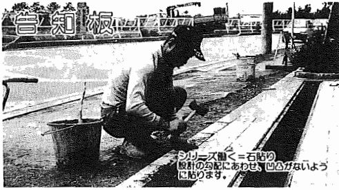
シリアス職く=石貼り 設計の完成にあわせ、 「あひこ」 に 貼ります。

平成元年10月1日現在 (対前年比) *人口120,111人(+2,478人) 男60,322人 女59,789人 *世帯数37,947世帯(+1,153世帯)