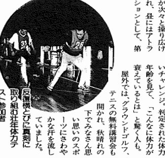
反復横切りに真剣に取り組む若者たち

「体育の日の10月10日、市民体育館が一般開放され、市民レクリエーション大会が開かれました。この日は澄み切った青空が広がる。スポーツ日和。家族連れが、親子リレーや夫婦仲よく、バキい競走と家族で楽しむ競走が次々と繰り広げられ、社にはアトラクションとして、第10回「あひこ」の無償講習会も開かれ、秋晴れの下でみなさん思い思いのスポーツにさわやかな汗を流していました。