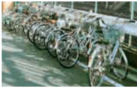
後田放置自転車保管所

状態にある自転車をいいます。買物のために歩道上に止めた自転車も放置自転車です。 ■後田放置自転車保管所 ☎7183・5470、交通課・内線330