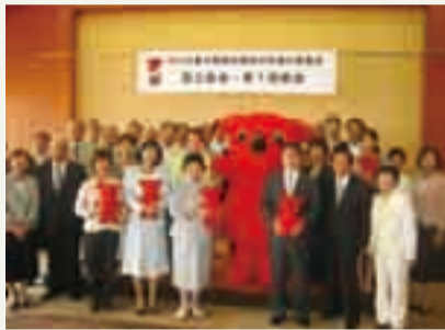
▲国体のマスコット「チーバくん」も登場

市では、なぎなた競技会開催に向け、7月1日に中央学院大学30周年記念館で「ゆめ半島千葉国体我孫子市実行委員会設立総会」を開催し、我孫子市長を会長に実行委員会を設立しました。