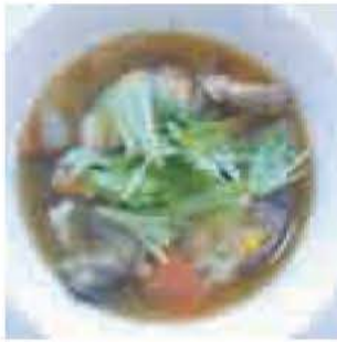
▲最優秀賞の「野菜たっぷり三色だんごすいとん」

市内在住・在学の小・中学生を対象に行われた朝食レシピコンクール。下表のとおり入賞が決まり、平成20年11月23日の健康フェアで受賞者の表彰式と試食が行われました。