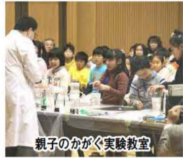
親子のかがく実験教室

市では、「若い世代に魅力ある、子育てしやすいまちづくり」を「我孫子市第二次基本計画」の重点プロジェクトに位置づけ、子育て支援策をより一層推進していきます。今号では、現在の主な子育て支援策の状況と今後の事業予定をお知らせします。