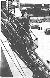
はしご車による高所救出訓練

「9月1日午前10時、南関東地域において大地震が起これ、我孫子市でも震度6の地震を記録し、家屋の倒壊、道路損壊などの被害が発生」との想定で、総合防災訓練を実施します。お間違いないようご注意ください。 ▼日時 9月1日(土)午前10時 ▼問い合わせ 市民生活課