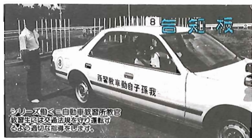
シリーズ③自動車教習所教習 教習生は交通法規を守り運転する おまわり指導をします。

平成2年8月1日現在 人口121,084人(+1,191人) 男60,817人 女60,267人 *世帯数38,875世帯(+1,035世帯)