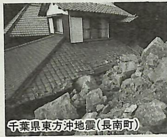
千葉県東方沖地震(長南町)

豪雨や台風そして大地震... 災害から生命と暮らしを守るために、市民自らも参加して、自治会・町内会等を範囲に身近な災害危険箇所を調べ、災害防止の診断プランをまとめる。それが前号でも紹介した今年度からはじまる市民参加の地域防災カルテづくりです。そして、防災ウォッチングとは、防災カルテをつくるための実地調査のことで、そのノウハウをモデルコースにそって、地元を理解を深めながら学ぶ催しです。