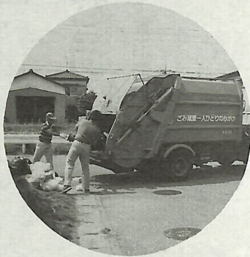
ごみは決められた日に、決められた場 所に正しく出しましょう