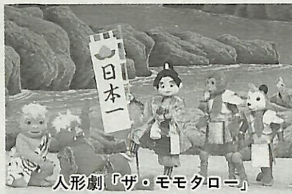
人形劇「ザ・モモタロー」

9月21日から30日まで「秋の全国交通安全運動」が実施されます。 市では運動期間中の9月23日(秋分の日)、子どもたちを対象に人形劇やショーなどで楽しみながら交通ルールが覚えらる「ちびっこ交通安全大会」を開催します。