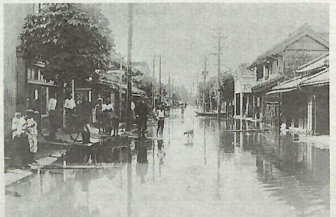
昭和13年、手賀沼の水害で水に浸る旧布佐町付近の成田街道

昔の思い出の写真から当時の手賀沼を振り返ってみませんか。(このシリーズは毎月1日号に掲載しています)