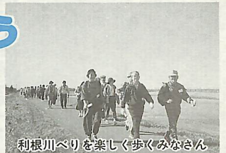
利根川べりを楽しく歩くみなさん

手賀沼周辺の自然と史跡にふれながら、楽しく歩きましょう。(全3回) ▼時間 午前9時30分から午後3時まで ▼講師 我孫子市歩こう会 会員、市史研究センター会員、湖北座会会員 ▼参加費 300円 ▼持参 弁当、水筒、敷物 ▼申し込み・問い合わせ ハガキに住所、氏名、年齢、電話番号を明記し、中里81の3 湖北地区公民館「楽しく歩こう」係 ☎88-4433へ