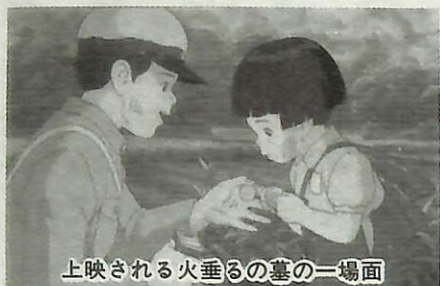
上映される火垂るの墓の一場面