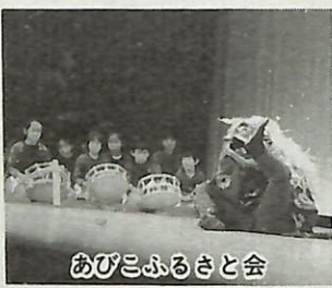
あびこふるさと会

市内には、古くから伝わる民俗芸能と日本古来の伝統的な笛・太鼓によるお囃子が残されています。これらには、古くから伝わる民俗芸能と日本古来の伝統的な笛・太鼓によるお囃子が残されています。