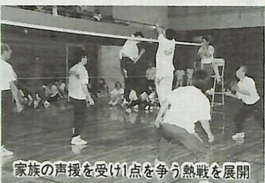
家族の声援を受け1点を争う熱戦を展開

10月8日(土)、第11回農家スポーツ大会が市民体育館・野球場で、約600名が参加して行われました。同大会は、市内農家の親