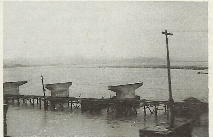
昭和30年代の手賀大橋架橋工事