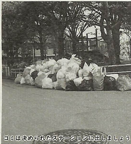
ゴミは決められたステーションに出しましょう