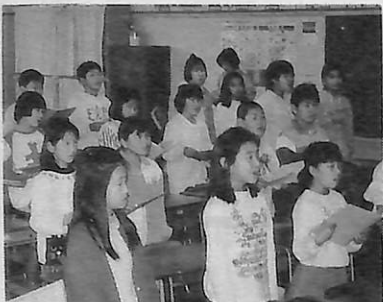
真剣な表情で練習する第一小合唱団