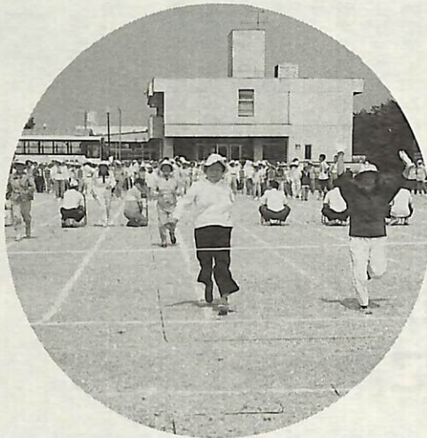
すべての皆さんが安心して楽しく暮らせるまちに