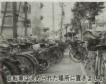
自転車は決められた場所に置きましょう

今年も6月25日に消防法大会が市内で行われましたが、1月17日未明に発生した神戸での地震を教訓に、各消防団とも熱の入った競技を展開。小型ポンプの部では第8分団が、自動車の部では第3分団がそれぞれ優勝。現在は、7月12日に船橋市で行われる9市2町の東葛飾支部消防操法大会の出場に向け、連日、先頭に立ち、後輩たちの指揮・指導にあたっている。 今後も「地域防災の担い手として12万市民の生命と財産を守るため、市民に信頼される消防団を築いていきたい」とキッパリ。60歳。