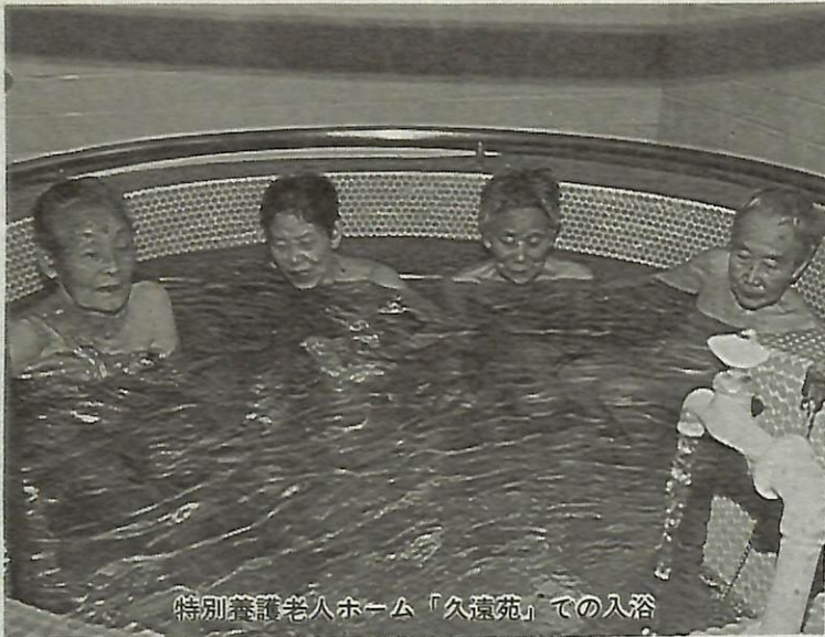
特別養護老人ホーム「久遠苑」での入浴

65歳以上の高齢者を対象に、それぞれの状況に応じて、次のような福祉サービス(表1参照)があります。 ◎サービスの内容 ◆緊急通報システムの利用・老人福祉電話の貸与 ひとり暮らしの方や寝たきりの方が、急病になった時や事故などが起こった時、消防署等に連絡したり、相談や助言したりするために設置します。