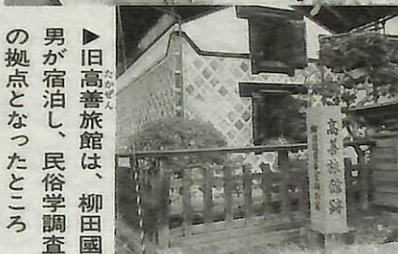
旧高善旅館は、柳田國男が宿泊し、民俗学調査の拠点となったところ