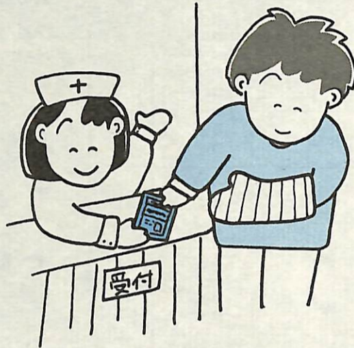
国民健康保険 II 国民年金課

国民健康保険の制度は、皆さんがけがや病気をしたときに、医療費の心配をせずに必要な治療を受けることができる、無くてはならない制度です。広報あびこ2月1日号(4)面では、国民健康保険の概要と異動の手続きについてお知らせしましたが、今号では、国民健康保険で受けられる給付や被保険者証の更新について紹介します。