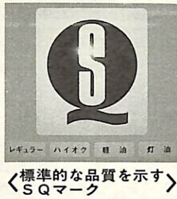
標準的な品質を示す「SQマーク」

石油精製会社(元売り)だけに輸入を認めていた特定石油製品輸入暫定措置法(特石法)は、3月31日で廃止され、新たに4月1日からガソリン、灯油、軽油などの石油製品の輸入が自由化されました。 今回は、石油製品の状況についてお知らせします。 ◎安定供給と品質維持 安定供給では、従来原油などを大量かつ継続的に輸入する業者に義務付けていた「石油備蓄法」を改正して、少量の製品輸入を行うすべての輸入業者にも備蓄を義務付けることにより、供給を安定させます。 品質の維持では、これまで「揮発油販売法」において、揮発油の一部項目についての品質が定められていたものが、さまざまな品質の製品輸入に備えて、ガソリンに限らず