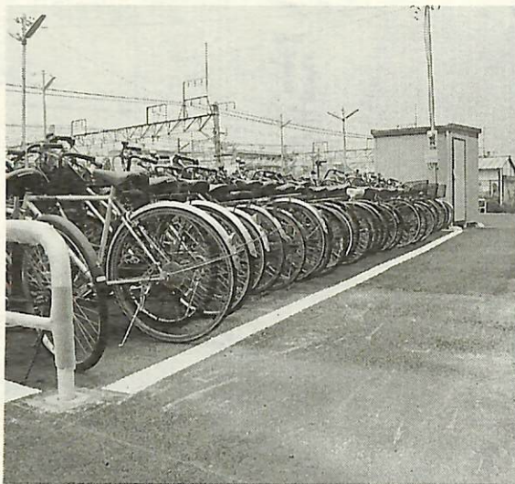
管理棟を設置した我孫子駅南口第2自転車駐車場