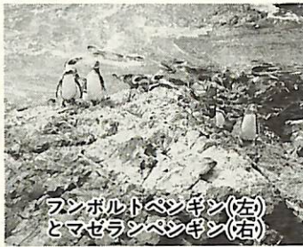
ランボルトペンギン(左)とマゼランペンギン(右)

第21回鳥の博物館企画展「ペンギン」にちなみ、フンボルトペンギン保護国際会議のために来日する研究者を招き、ペンギンの生息状況と研究・保護活動についての講演会を開催します。 なお、当日は通訳が付きまですので、企画展の観覧とあわせてお楽しみください。 ▼日時 11月30日(土)午後1時30分から3時30分 ▼場所 鳥の博物館 ▼テーマ ペンギンは今 ▼講師 ブラウリオ・アラヤ博士(鳥類研究者)、ボースマ博士(ペンギン研究者) ▼定員 先着70名 ▼問い合わせ 鳥の博物館 ☎(85)2212