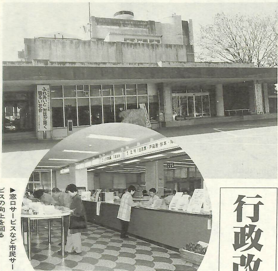
窓ロサービスなど市民サービスの向上を図る