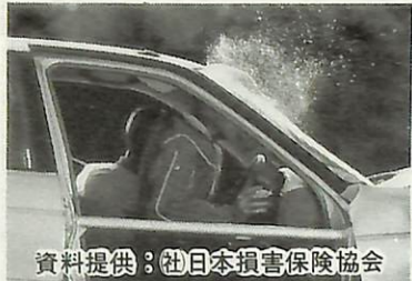
資料提供: 社日本損害保険協会

今日から6月30日(月)まで、シートベルト着用推進キャンペーンを実施します。県内におけるシートベルト着用率は、最近の調査では50%台に落ち込んでいます。一方、今年1月からの県内の交通事故死者数は200人を超え、全国ワースト1となっています。シートベルト着用率の低下が、ワースト1の大きな要因の一つといえます。また、自動車乗車中の事故による死者の9割がシートベルトを着用しておらず、このうち約4割がシートベルトを着用していれば、命が助かったものと推定されています。車に乗ったら、まずシートベルトをしめましょう。