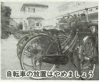
自転車の放置はやめましょう

10月1日(水)から11月30日(日)まで「困ります自転車置き去り知らんぷり」を合言葉に「駅前放置自転車クリーンキャンペーン」を行います。