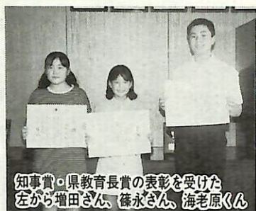
歯の衛生週間の一環として行われた県口腔保健図画ポスターコンクール、8020運動普及作文・標語審査会、県健康歯生徒コンクールにおいて、市内から次の方々表彰されました。

歯の衛生週間の一環として行われた県口腔保健図画ポスターコンクール、8020運動普及作文・標語審査会、県健康歯生徒コンクールにおいて、市内から次の方々表彰されました。 北台