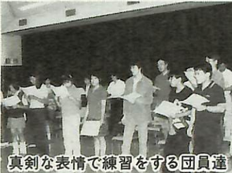
真剣な表情で練習をする団員達

市内初、若者たちの合唱団誕生 中学・高校生を中心とした混声合唱団が市内に初めて誕生し、8月30日に市民会館で初練習を行いました。 名称は「アィクル」。 「身近に合唱を楽しめる場がほしい」という高校生の練習に参加した団員は、一様に「楽しい」、「これからも続けていきたい」と感想を述べた。 11月23日(祝)の市合唱祭で、初演奏を披露する予定。 ▼問い合わせ ☎賀来(87)5275