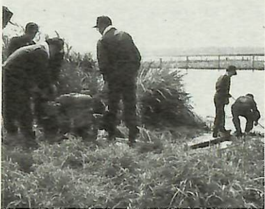
▲事故車からの救出救護訓練 ▲手賀沼の水を使っての中継送水消火訓練

9月1日(月)、総合防災訓練が手賀沼公園多目的広場を中心会場に市内4カ所、地域の自治会や婦人防火クラブなど総勢960人が参加して行われました。 今回は、我孫子南部・北部地域対策支管管内を対象に、震度7の直下型大地震が発生したとの想定で訓練を開始。残暑の中、医師会によるケガ人の搬送救護訓練、多重事 故により横転した車から負傷者を救出する訓練などが行われました。また、1時間当たり4トンも浄化できる特殊フィルター装着の浄水器を使い、手賀沼の水を生活用水にする訓練も... 今回初めて行った中継送水消火訓練では、消防署と消防団が、手賀沼から我孫子四小まで高低差17m、総延長約700mを6台のポンプ車、35本のホースでつなぎ、見事に送水。 参加者は、消火器での初期消火訓練や炊き出しに積極的に取り組んでいました。