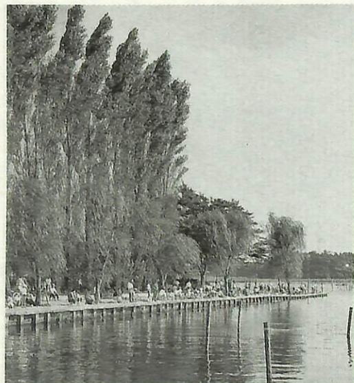
▲手賀沼公園内ポプラ並木