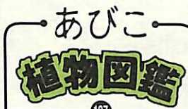
スズメウリ (うり科)

つけたスズメウリに出会いました。葉はすずでしほみ、白っぽい小さな果実のみが目立っていました。スズメウリは原野や水辺に生えるつる性の一年草で、葉はほぼ三角形をしています。茎には葉が変化した巻きひげがあり、ものからみついつる状の茎を支えます。このような性質は同じウリ科のアマチャツルやカラスウリにもみられます。花には雄花と雌花の別があり、八・九月頃開きます。果実は球形または卵形で、直径は一から二センチです。色は初め緑ですが、熟すと灰白色になります。スズメウリとはかわいいうりですが、果実がカラスウリより小さいからとか、果実をスズメの卵に見立てた名だとかいわれます。(文・写真 佐久間俊之)