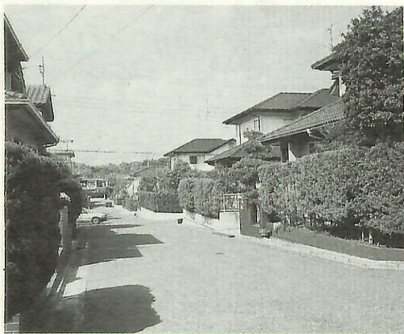
▲布佐平和台住宅地区