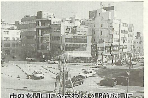
市の玄関口にふさわしい駅前広場に

10年度は先行事業として、商店街マップづくりや鳥をモチーフとした街路灯の設置を支援します。