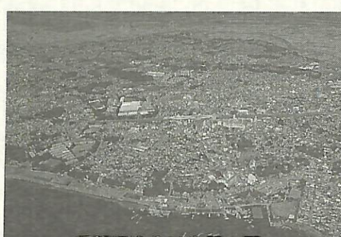
手賀沼浄化は市民の願い

《グリーンセンターでのダイオキシン低減対策》 活性炭を吸着剤として混入させた消石灰を電気集塵機入口より噴射し、処理する方法を実施したところ、1号炉で1.1ナノグラム、2号炉で1.6ナノグラムとなりました。今後も一層の低減対策を調査・研究します。