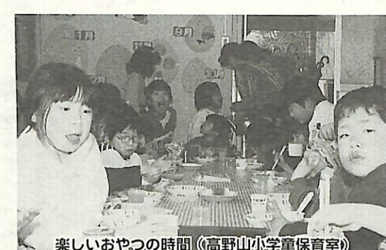
楽しいおやつの時間(高野山小学童保育室)

のデイサービス事業は、利用希望者の待機を解消するために、現行の時間の延長と、日曜日及び祝祭日への利用日の拡大を実施します。