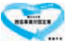
▲推進事業所認定章

「ごみ減量・リサイクル推進事業所認定制度」は、ごみの減量やリサイクルを推進している店舗などを市が認定し、広報あびこなどで広く市民の皆さんにお知らせし、消費者の利用を促進することにより資源循環型社会の実現を目指すものです。現在認定されている事業所は下表のとおりです。※認定事業所の要件や手続きなど、詳しくはクリーンセンター☎7187-0015へお問い合わせください。