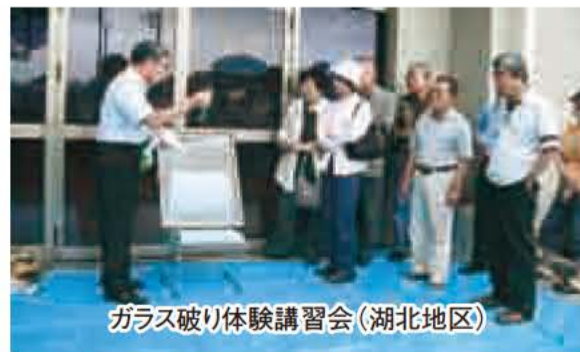
ガラス破り体験講習会(湖北地区)