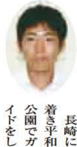
長崎に着き平和公園でガイドをして

くれた人から「原爆で浦上が一瞬にして廃墟となり、爆風で重い石がずれてしまいました。原爆が落ちたときの土地が残っており、茶わんなど生活に必要な物がそのまま地面の一部になっています。そんな土地の上に私たちは立っているのです」と説明を聞きました。