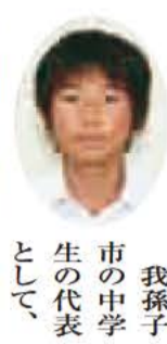
我孫子市の中学生の代表として、