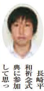
長崎平和祈念式典に参加して思ったのが、この式典は日本の行事ではなく、世界の行事だということだ。それは、外国の人達がたくさん参加している、平和について世界中が考えていることがわかったからです。

青少年ピースフォーラムでは、被爆者の話を聞いて、原爆の怖さを改めて実感しました。