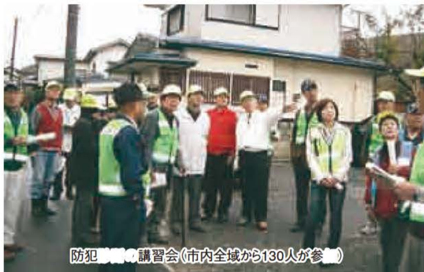
防犯講習会(市内全域から130人が参加)