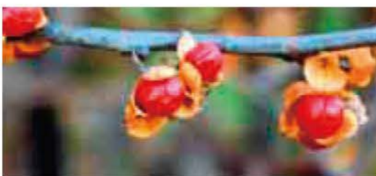
文・写真 佐久間 俊行

花は小さく、黄色で、径はおよそ7ミリです。雄木の花には大きな雄しべと小さな雌しべがあり、雌木の花には大きな雌しべと小さな雄しべとがあります。どちらも小さい方は退化して機能しなくなっています。雌木にできる果実は球形で、径がおおよそ8ミリです。