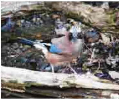
文 塩田 いづみ (鳥の博物館学芸員)

カケスは、このあたりでは冬によく見られる鳥です。比較的警戒心が強く、少し暗い林で見られます。ジェーイジェーイと特徴のあるしわがれた声で鳴くので、声をたよりに探すと見つけられるかもしれません。頭には白地に黒の斑があり、目先尾は黒、体は淡褐色、翼の一部にコバルトブルーの美しい模様があります。