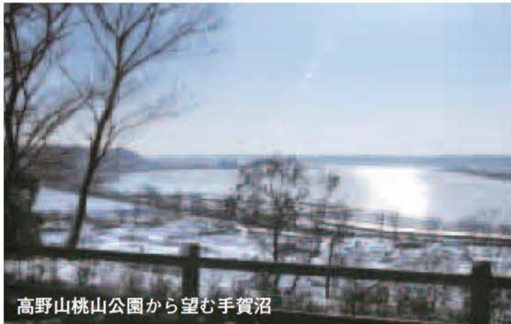
高野山桃山公園から望む手賀沼