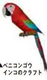
▲ベニコングウインコのクラフト

鳥の博物館前に広がる手賀沼と周囲のヨシ原、水田と背後の斜面林。我が孫子の自然を特徴づける自然環境の中で、鳥とそれにかかりあっている暮らしをさまざまな生き物を観察し