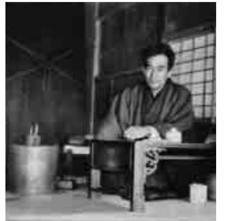
▲我孫子の家の離れの書斎(大正10年頃)