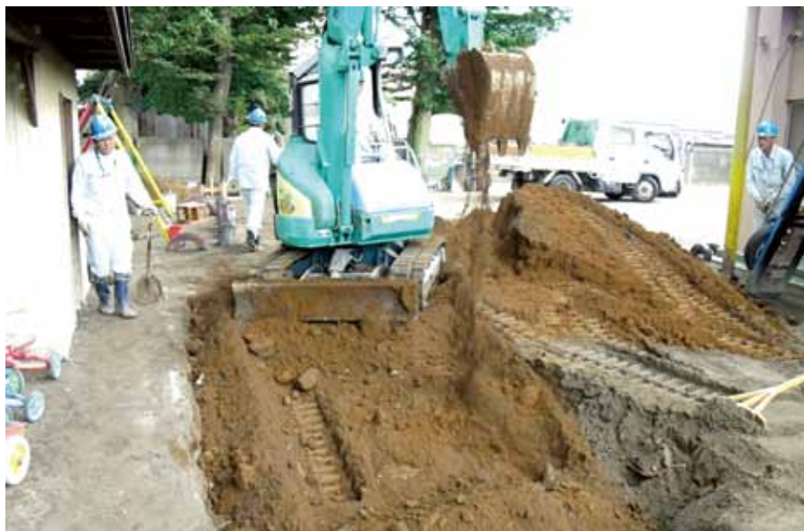
▲保育園での除染作業