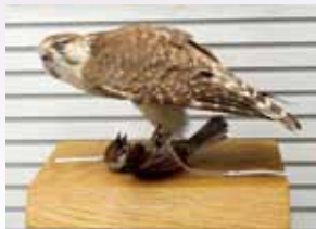
▲コチョウゲンボウの狩り

内容 鳥の博物館では、これまで開催した企画展の中でさまざまなジオラマ(生態展示標本)を作製し、展示してきました。