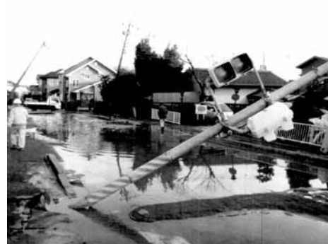
▲液化化による被害(東日本大震災・布佐郡)

3月11日に発生した東日本大震災は、各地で未曾有の被害をもたらしました。いつ起こるか分からない大規模災害に備えて、日ごろから被害を減らす取り組みが大切です。また、これから台風と大雨のシーズンです。台風の接近や大雨に備え、気象情報に注意し、家や周囲の点検などをおこなってください。