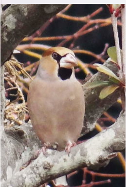
▲この時期に谷津田で見られるシメ

日時 3月21日(祝)午前9時～正午 集合場所 午前9時に東我孫子駅南口(雨天中止) 内容 野鳥を中心に、早春の生き物を観察します。岡発戸・都部の谷津田では冬鳥も見られる中、ウグイスのさえずり、キジの母衣打ちなど春を感じることができます。いち早く春を感じてみませんか。 定員 先着30人(小学4年生以下は保護者同伴) ※要申込 費用 100円(資料・保険代) ※小・中学生は無料