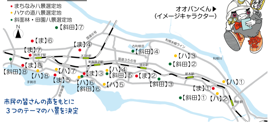
市民の皆さんの声をもとに3つのテーマの八景を決定