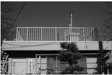
測定結果(日平均値) 単位:(マイクログラム/立方メートル)

千葉県大気汚染常時監視我孫子市湖北台測定局(湖北台東小学校敷地内)に微小粒子状物質(PM2.5)自動測定器が設置され2月から測定を開始しました。