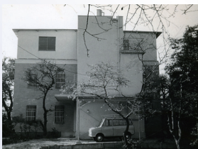
▲南平台研究所(改築後)