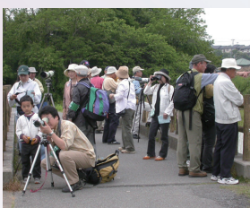
▲新緑の中、バードウィーク手賀沼探鳥会