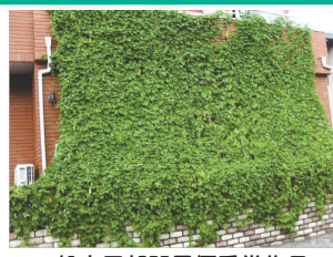
▲一般市民部門最優秀賞作品(2012年)