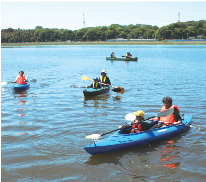
▲春の手賀沼でカヌー体験を楽しむ人々

Enjoy手賀沼!は、一人ひとりがふるさと手賀沼とのかかわりを感じながら楽しく一日を過ごすというイベントです。楽しい企画をたくさん用意して皆さんをお待ちしています。