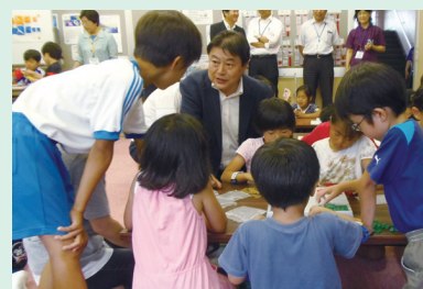
▲湖北台東小学校内あびっ子クラブ

6月には、市内で5校目となるあびっ子クラブを湖北台東小学校に開設しました。また、我孫子第四小学校には、鉄骨造2階建ての学童保育室を新築します。7月下旬に工事を開始し、来年3月に完成する予定です。