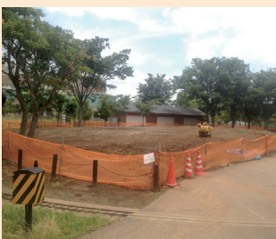
▲ミニSLが再開される手賀沼公園

手賀沼公園や高野山桃山公園など9つの公園で工事に着手し、秋までには完了する予定です。