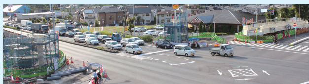
▲歩道橋工事の状況(7月2日時点)

現在、国道6号に架かる通路部分が設置され、8月末の開通に向け工事が進められています。