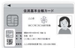
▲公的な本人確認書類として使用できます

写真付きの公的な証明書が必要)を希望される方は、市役所市民課で申請してください。 ◎我孫子行政サービスセンターの夜間(月・水・金曜日午後5時～8時)および土曜日は申請・受け取りはできません。 ◎本人が来庁できない場合や、15歳未満の方が申請される場合についてはお問い合わせください。 ◎市民課 内線318・360