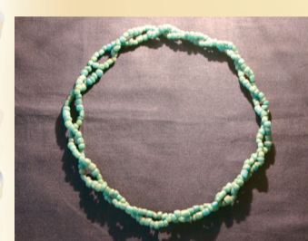
▲出土したガラス小玉ネックレス(水道局1階ロビーに展示)

古墳が作られたのは4世紀末と推測され、全長69mを誇るこの古墳は東葛地区最大で、県の指定文化財にもなっています。古墳の大きさは勢力を計ることもつながり、大きな勢力を持っていた王がここに埋葬されたことがわかります。墳丘も極めて端正な形で残っており、昭和40年に行われた発掘調査では遺物も出土しています。珍しいガラス小玉や針が出ており、その状況から被葬者は、ガラス小玉のネックレスを胸に、左手首にはブレスレットをして、足元には刀子(鉄製の小刀)と針が置かれていたと推測されています。