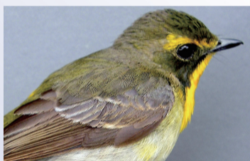
▲リュウキュウキビタキ