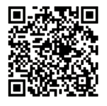
専用ホームページ QRコード