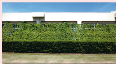
▲昨年の最優秀賞(団体)

日時 5月10日(土) 午後2時～ 場所 アビスタ公園側入口の外側 配布数 200本(なくなり次第終了、1人2本) ※ゴーヤの育て方・緑のカーテンの作り方の説明書あり