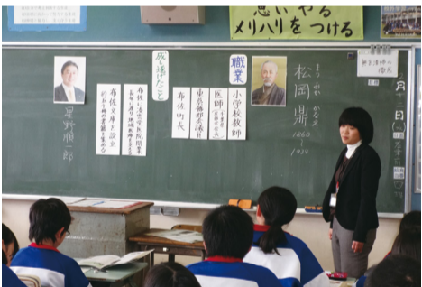
▲中学校での「ふるさとカリキュラム」授業

市の「よさ」や各中学校区の特徴を生かし、小学校と中学校、そして地域が一体となって子ども達を育てることが、我孫子市の学校教育の充実や地域の活性化に