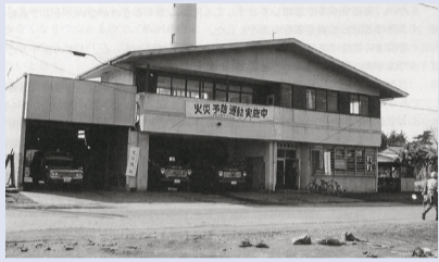
▲当時の消防団常備部

昭和36年9月のこと、真夜中の我孫子に火柱が立ちます。我孫子中学校で火災が起きたのです。この火災は、地元や隣接の消防団、自衛隊の協力なども得て必死の消火を行いました。水利も悪く3時間にわたって燃え続け、校舎のほとんどが焼ける大火となりました。