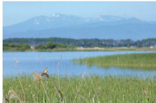
▲全日本鳥フォトコンテスト in JBF2013 環境部門グランプリ「湖畔の歌い手」

賞位 グランプリ…各1点(賞金5万円、賞状、副賞)、準グランプリ…各1点(賞金2万円、副賞)、入賞(副賞)