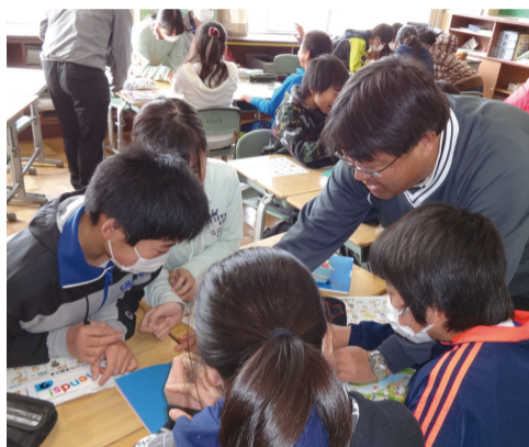
▲中学校教諭による、小学校での英語教育