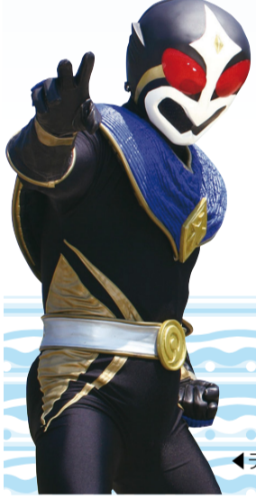
◀テガヌマンコート