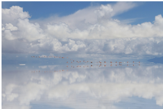
▲全日本鳥フォトコンテスト in JBF2013 生態・行動部門グランプリ「塩湖の上を飛ぶフラミンゴ」

テーマ ①生態・行動部門…飛翔やさえずり、採食、水浴び、かわいい・かっこいい表情など、鳥たちが見せてくれるさまざまな行動や生態を捉えた写真 ②環境部門…四季折々のさまざまな風景の中にいる鳥たちの姿、生息環境の異変や変化の中で生きる鳥たちを写した、問題提起の意味も込めた写真