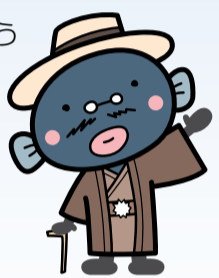
▲手賀沼のうなぎちゃん

※同日開催の「あびこ福祉まつり」会場へ水上バスで移動できます(荒天中止)。 ※詳しくはホームページをご覧ください。 http://abiko-city.jp/enjoy-teganuma/ 問 手賀沼課・内線467、前日・当日のみ☎090-3916-0100