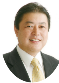
我孫子市長 星野 順一郎

我孫子の夏の風物詩である「手賀沼花火大会」を今年も実施します。昨年と同規模の1万3500発の花火が夜空を彩ります。