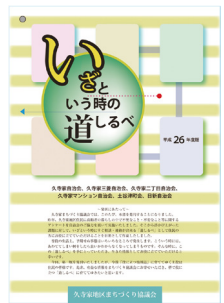
▲「いざという時の道しるべ」

各自治会長、民生・児童委員、まちづくり協議会を主体とし、これまで2回の地域会議を開催しました。地域の方へのアンケートを基に「いざ」という時の道しるべ(写真右)の作成に取り組み、9月上旬に発行しました。