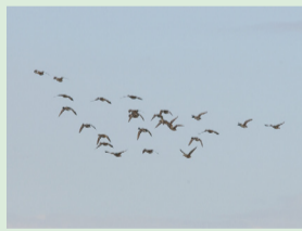
▲手賀沼に渡来したカモ類の群れ

秋が深まり、手賀沼にカモが飛来する季節になりました。カモの多くは冬を越すために北の地域から渡ってきますが、中には一年を通して手賀沼でみられるカモもいます。それは次のうちどれでしょう。