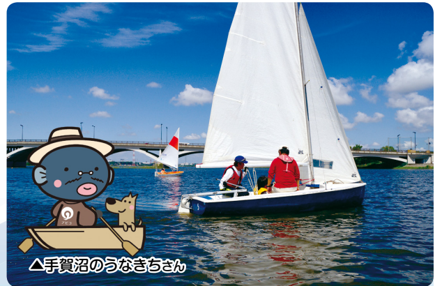
△手賀沼のうなぎちゃん

日時 5月10日(日) 午前9時～午後3時30分 場所 手賀沼親水広場 入場無料 ※雨天実施(一部中止・変更あり) ※鳥の博物館は当日入館無料 ※出店ブースは一部有料