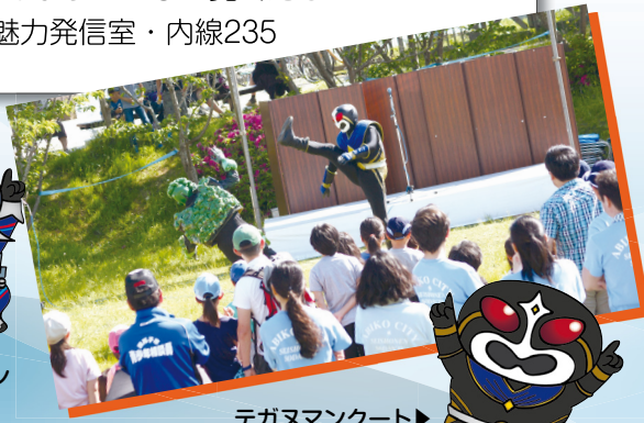
テガヌマンコート