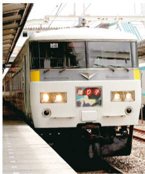
▲常磐線・成田線の利便性向上

*根戸小あびこ子クラブと児童保育室の運営を4月から民間事業者へ委託します。これにより、児童保育室の開室時間が拡大されるとともに、あびこ子クラブでの体験活動が充実します。