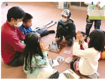
▲あびこ子クラブの様子