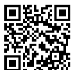
▲おひるねアート予約用QRコード