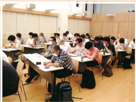
▲昨年度 プチ起業コースの様子