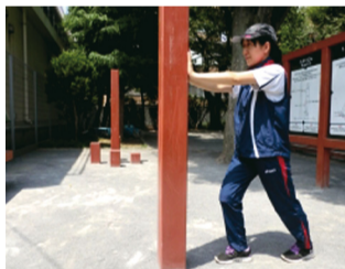
▲つますかない運動