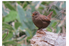
▲さえずるミソサザイ