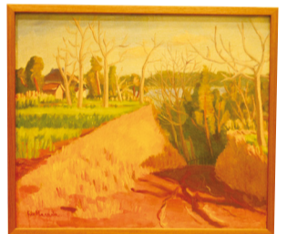
▲原田恭平「我孫子風景」 1923(大正12)年12月

日時 11月27日(日)午前9時15分～午後3時30分 内容 そば打ち体験、自己紹介、フリータイム 対象 女性 45歳～55歳、男性 45歳～60歳 定員 各12人(応募者多数の場合抽選) 費用 3500円